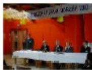
... pokračovanie článku

Už milý ročník, ktorý trval len jeden deň, má vyše 100 účastníkov. Prvého ročníka sa zúčastnilo 120 účastníkov, tento ročník zaradíme opäť nájsť. 135 účastníkov, vrátane vystavovateľov. V tomto roku konferencia prebehla opäť počas dvoch dní, zmena oproti minulému roku bolav tom, že väčšina rokovaní, okrem úvodnej zúž-